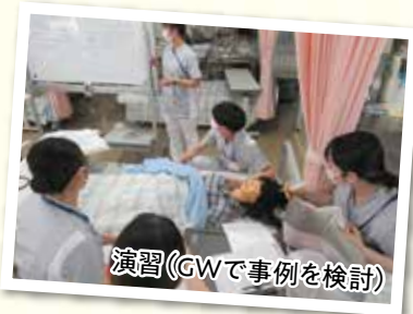
演習(GWで事例を検討)