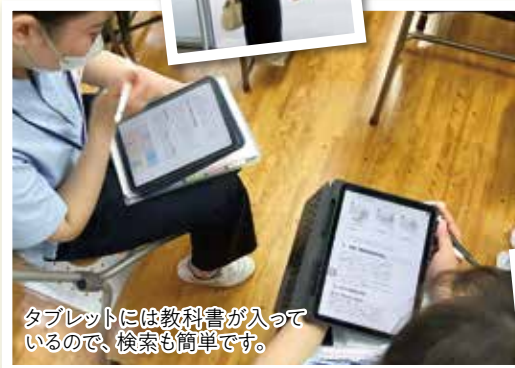
タブレットには教科書が入っている ので、検索も簡単です。