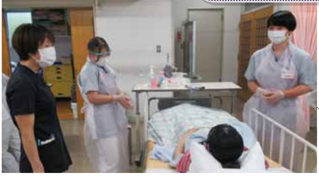
病院職員による講義

少人数のため、授業でわからないことも聞きやすいです。他学年とも仲良く気軽に相談することができます。 (2年生)