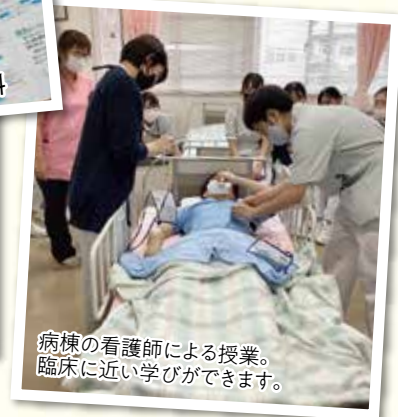
病棟の看護師による授業。 臨床に近い学びができます。