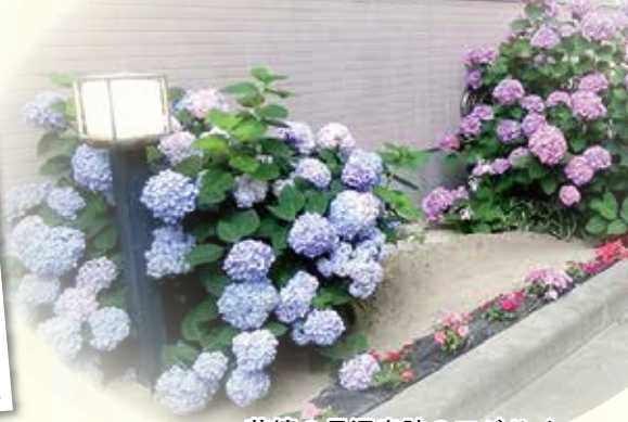
花壇の長沼奇跡のアジサイ