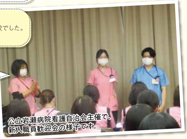
公立岩瀬病院看護自治会主催で、新入職員歓迎会の様子です。