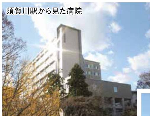
須賀川駅から見た病院