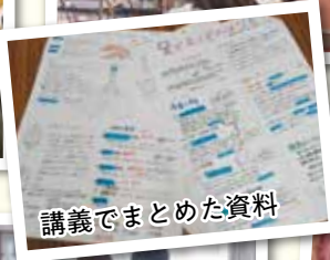
講義でまとめた資料