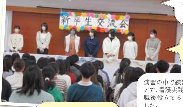
学生主催で、新卒生をお招きし、親睦をはかりました。

3年間学びの多い学生生活でした。先生方も優しく、丁寧に教えてくださるので、すごくよかったです。