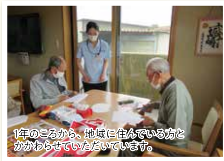
1年のころから、地域に住んでいる方と かかわらせていただいています。