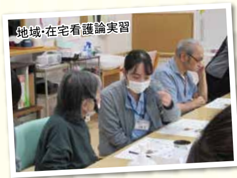
地域・在宅看護論実習