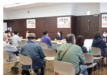
【健康相談会の様子】