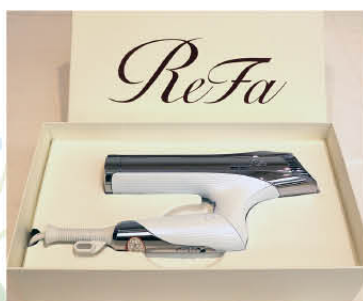
⑥ ReFa ビューテック ドライヤーS+