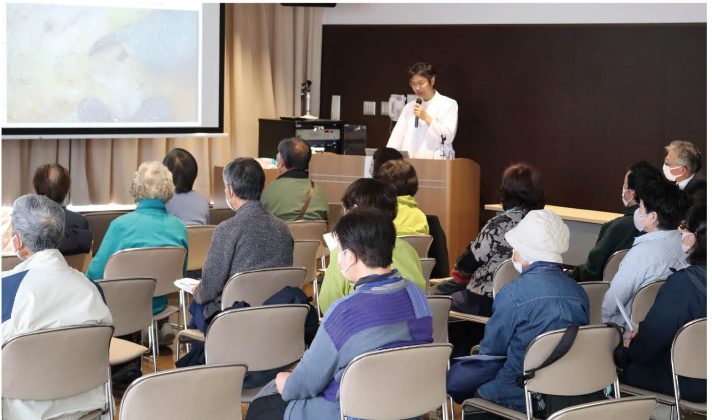
住民公開講座の様子