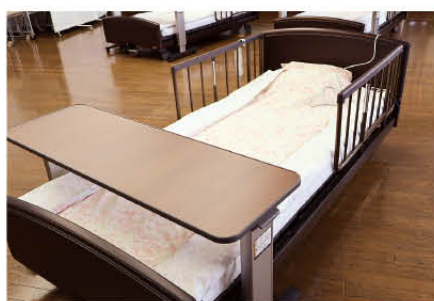
① 産科用ベッド ③ オーバーテーブル