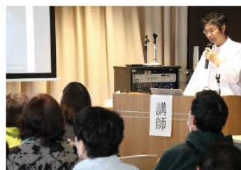
【住民公開講座の様子】

次回の開催は、10月1日(木)を予定しております。詳細は後日お知らせいたします。