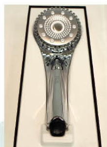
⑦ ReFa ファインバブルダイア 90