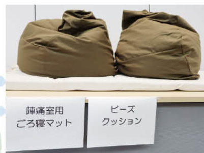
⑧ 陣痛室用 ごろ寝マット ⑨ ビーズクッション