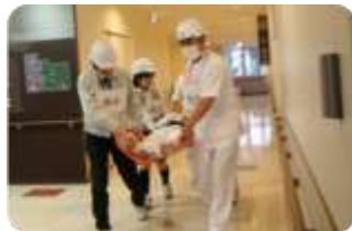
緊急設置した災害対策本部(左)と患者を救出する職員(右)