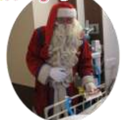
12月25日、フィンランドからやって来たサンタクロースが入院中の子供たちにプレゼントを手渡しました。