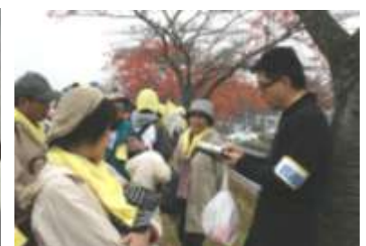
健康相談に応じる医師